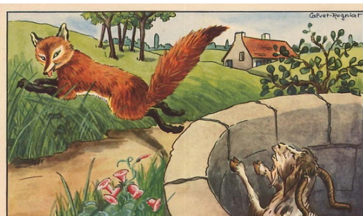
le renard et le bouc